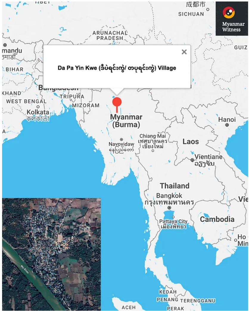
ပုံ 1- တပုရင်းကွဲကျေးရွာ၏ တည်နေရာ ကိုဩဒိနိတ်အမှတ် [22.049150, 95.669937]