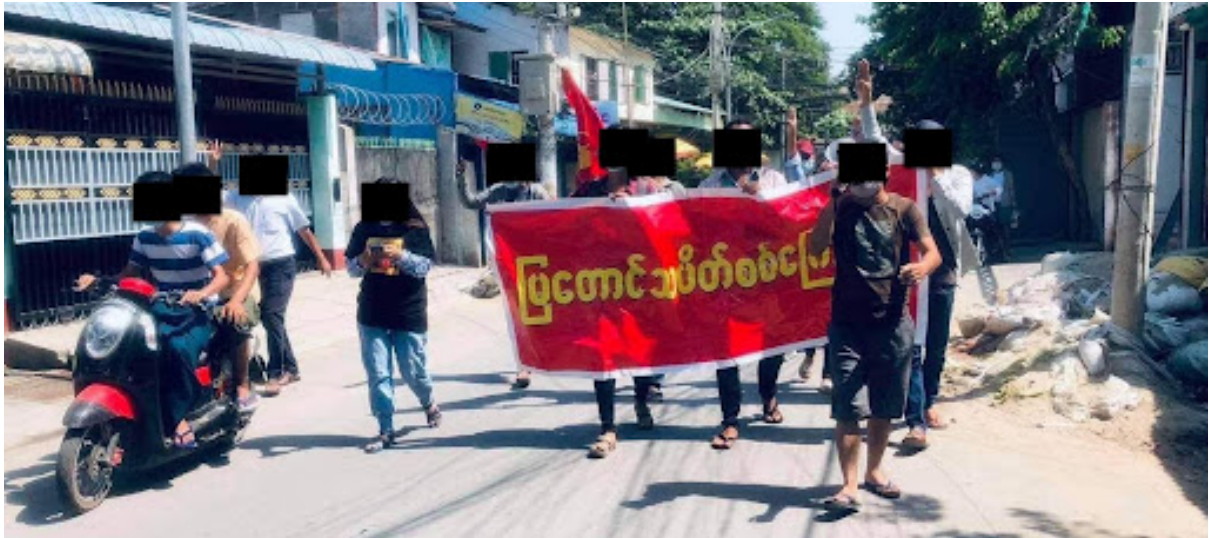
ပုံ ၁- ဆန္ဒပြလှုပ်ရှားမှုပုံရိပ်နှင့် ထင်ရှားသောအလံ (မြေတောင်သပိတ်တပ်ဦး)။

ထိုအဖွဲ့သည် အလံများမီးရှို့သည့်အချိန်တွင် (ပုံ ၂၊ ဇူလိုင် ၂၅၊ ၂၀၂၁)၊ Myanmar Witness မှသတ်မှတ်ထားသော User Generated Content (UGC) အရ လက်နက်ကိုင်ဆောင်ခြင်း (သို့မဟုတ်) အကြမ်းဖက်သည်ဟုဆိုသော အရိပ်အယောင်မတွေ့ရပါ။