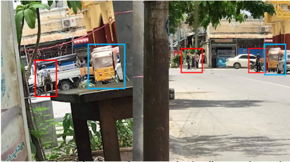
ပုံ ၇အေ - ၂၀၂၁ ခုနှစ် ဇူလိုင်လ ၂၇ ရက်နေ့၊ သူသူဇင်လှုပ်ရှားပြီး အသတ်ခံရသည့်နေရာတွင် လက်နက်ကိုင်အဖွဲ့အစည်းများအား ဖော်ထုတ်ခြင်း။ (နေ့ရက်တူညီသည်)