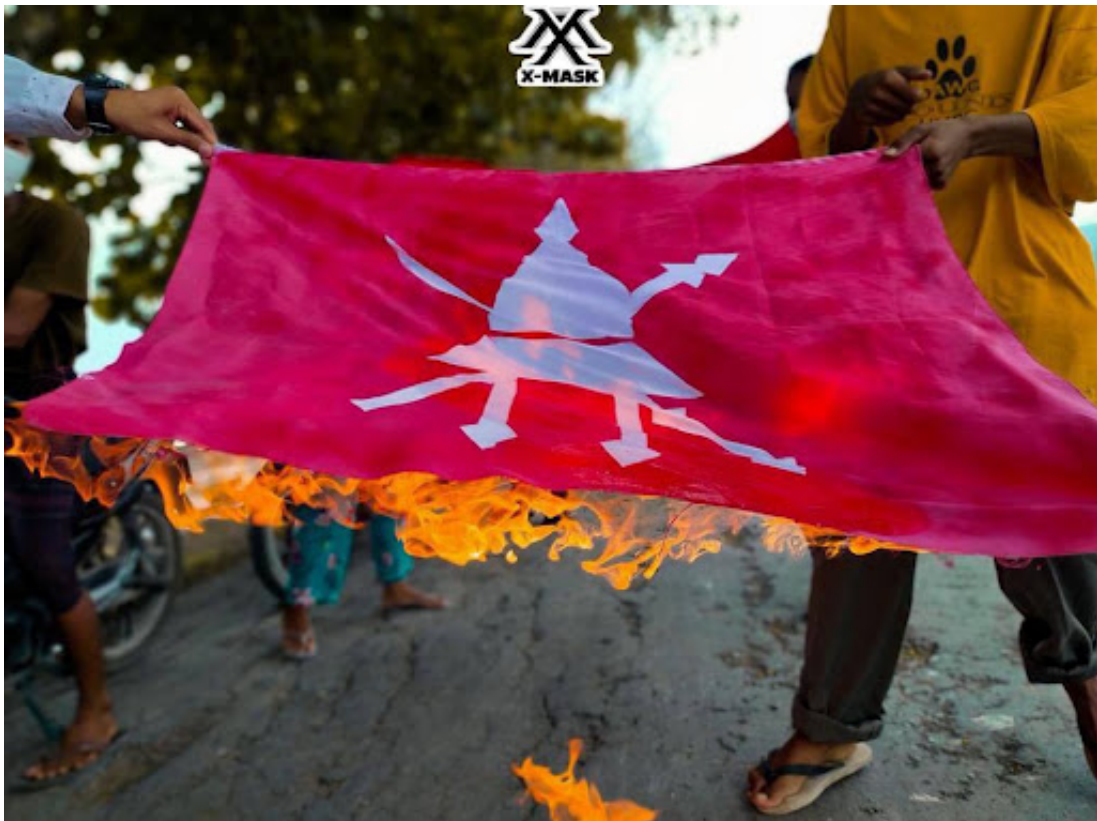
ပုံ ၂ - သူသူဇင်နှင့် အခြားဆန္ဒပြသူများနှင့် ဆက်စပ်သည့်ဆန္ဒပြပွဲများတွင် မီးရှို့ခံရသည့် မြန်မာတပ်မတော်အလံပုံ။

ထိုအဖွဲ့သည် အလံများမီးရှို့သည့်အချိန်တွင် (ပုံ ၂၊ ဇူလိုင် ၂၅၊ ၂၀၂၁)၊ Myanmar Witness မှသတ်မှတ်ထားသော User Generated Content (UGC) အရ လက်နက်ကိုင်ဆောင်ခြင်း (သို့မဟုတ်) အကြမ်းဖက်သည်ဟုဆိုသော အရိပ်အယောင်မတွေ့ရပါ။