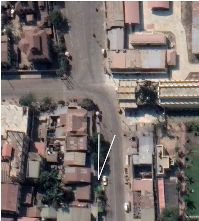
ပုံ ၇ဘီ - ပုံ ၇အေ ၏ရှုထောင့်ကိုကိုယ်စားပြုသော ဂြိုဟ်တုရုပ်ပုံနှင့် ဂရပ်ဖစ်။